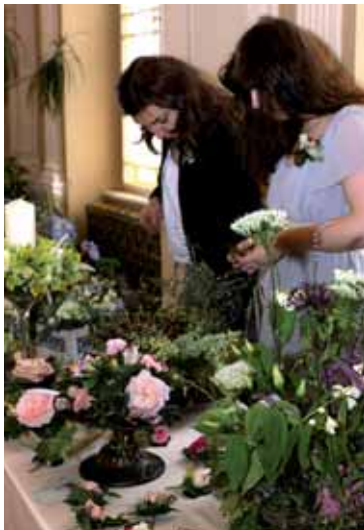
Výstava květinových vazeb a aranží Květinářství Evergreen byla ve stálém obložení žen.