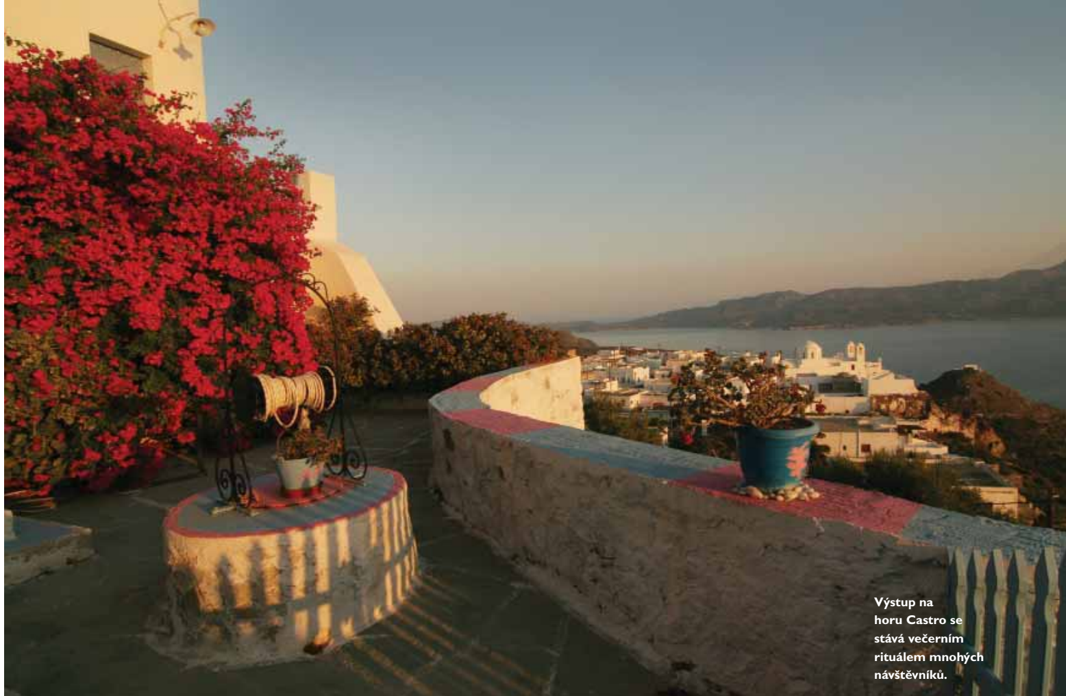
Výstup na horu Castro se stává večerním rituálem mnohých návštěvníků.

Krásně slunečno je na ostrovech až do konce října. Moře je vyhřáté, přitom nejsou taková horka a dopřát si můžete sladké hrozny, broskve i melouny. Podzim je také ideální dobou pro výlety na kole, které si můžete půjčit přímo na místě.