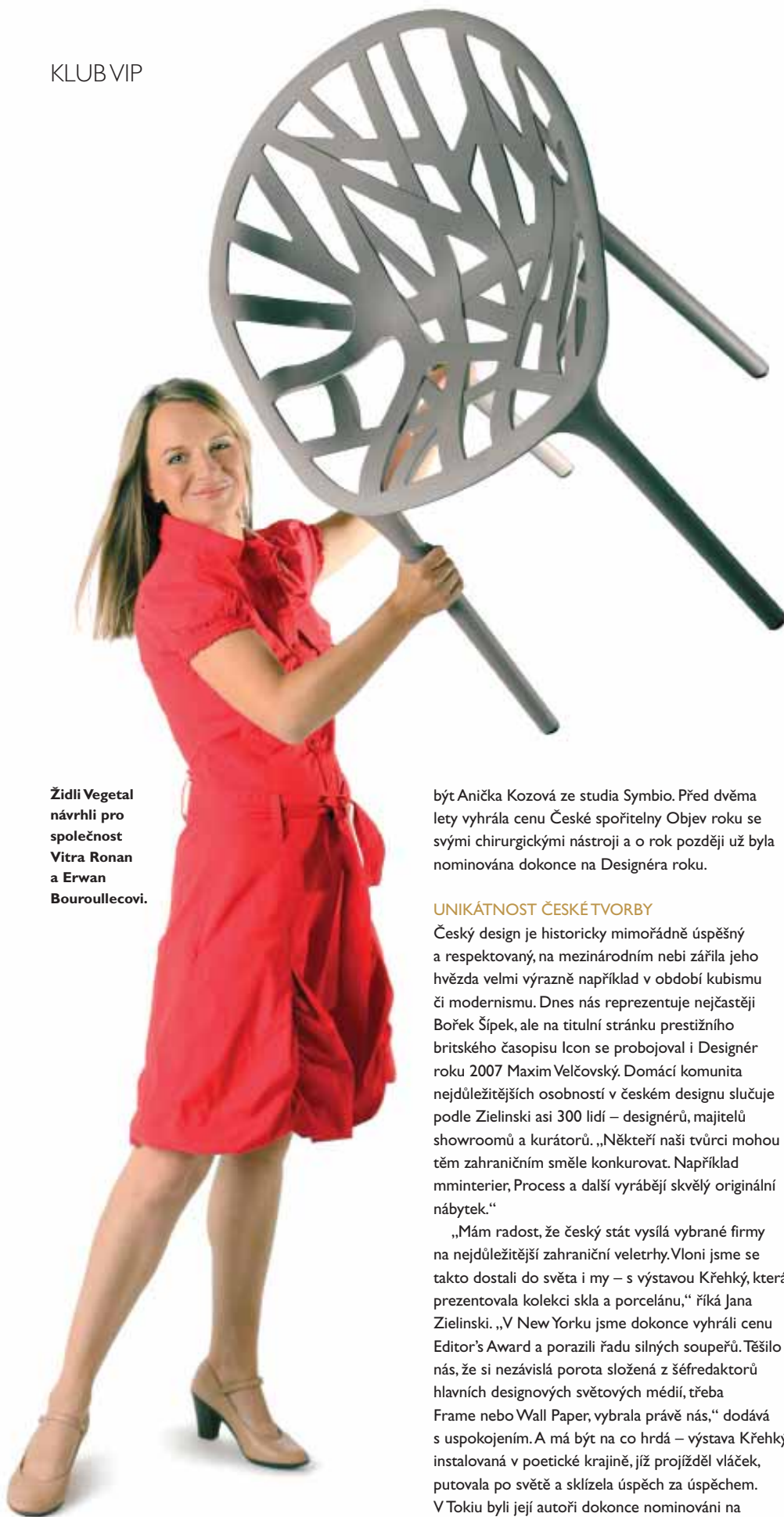
Židli Vegetal návrhli pro společnost Vitra Ronan a Erwan Bouroullecovi.